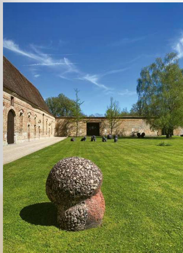
Claudi Casanovas (au 1 er plan), Corallina-B