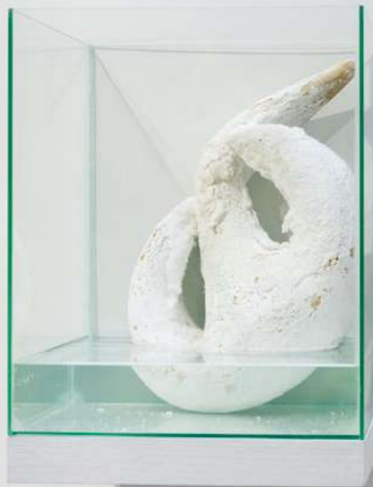
Lise Thiollier. This desert was once a sea , 2021 ©Alexandra de Cossette

🌐 SITE WEB : ville-mehun-sur-yevre.fr/tourisme/decouvrir-mehun/patrimoine/pole-de-la-porcelaine