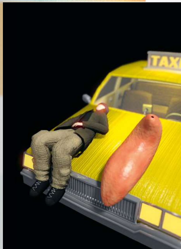
Visuel de l'exposition Are we there yet? , 2024 ©Woojung Yim et Abel Duché